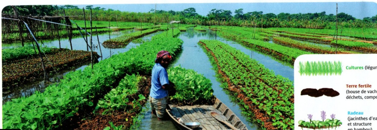
D Le développement des jardins flottants (Nazirpur)