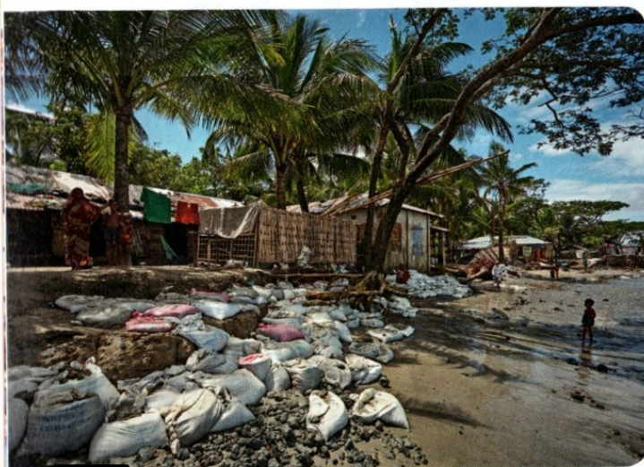
E Des digues destinées à réduire les risques